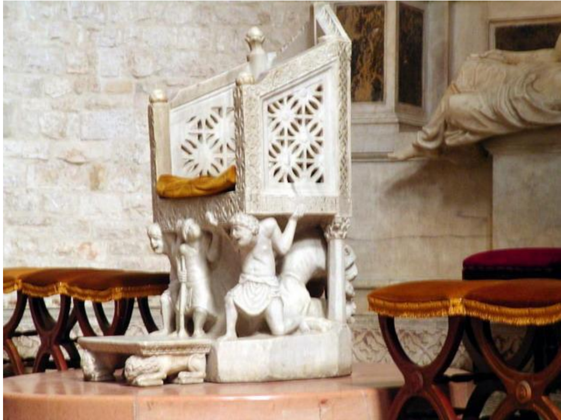
Bari, Basílica di San Nicolás, interior, cátedra del abad Elia

En la zona presbiteral, los viajeros pueden admirar la cátedra del abad Elia propiamente dicha. El asiento, destinado al sumo sacerdote, es completamente esculpido en mármol por un artista que ha sido capaz de conjugar la elegancia bizantina en el tratamiento de las partes decorativas, con el expresionismo románico de los atlantes que sustentan la cátedra, retratados con la cara deformada por el esfuerzo y el peso del pecado.