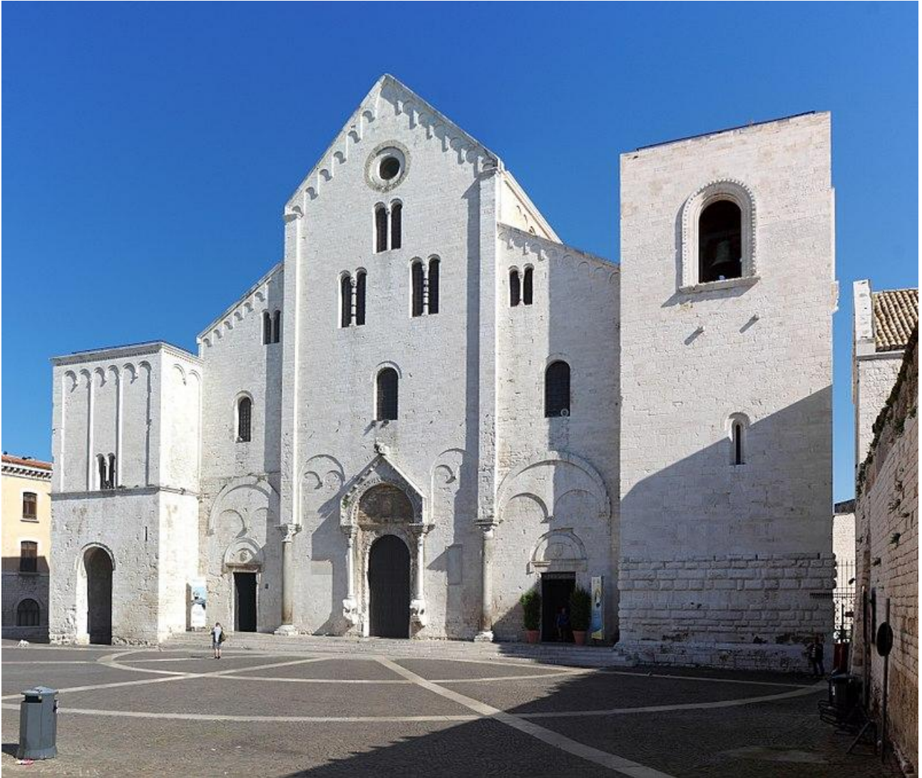
Bari, Basílica de San Nicolás

La Basílica de San Nicolás, querida por el abad benedictino Elia en 1089, fue consagrada en 1197. El culto abad quiso realizar un edificio que en sí mismo pudiera resumir numerosas funciones y diferentes significados. Tenía que ser una iglesia de peregrinación, la iglesia madre de los habitantes de Bari y un punto de referencia para los que llegaban desde el mar e inmediatamente se enfrentaban con el gálibo sobresaliente desde sus torres.