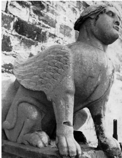
Bari, Basílica de San Nicolás, esfinge esculpida sobre el ventanal del ábside, particular.

En realidad la posición de la basílica de san Nicolás, a pesar de la leyenda, no es en absoluto casual, sino que responde a precisas exigencias simbólicas y políticas. La nueva iglesia palatina tenía que surgir allí donde surgía el palacio del Catapano, para indicar que ahora el Santo patrón y, con él, los señores normandos que habían patrocinado la construcción de la iglesia, iban a ocupar el sitio y el papel que un tiempo había sido de los bizantinos; además la posición cerca del mar tenía que enfatizar la estrecha relación de la ciudad con el Adriático. Por eso la zona del ábside de la basílica, orientada hacia el mar, es tratada como si fuera una segunda fachada, con un ventanal muy grande decorado por animales esculpidos. Se trata de elefantes y esfinges, que además de sus significados simbólicos, aluden al Oriente hacia el que se dirigían o desde el que volvían los peregrinos y mercantes que se embarcaban a Bari bajo la protección de San Nicolás.