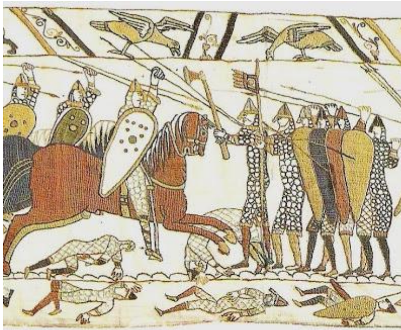
Tapiz de Bayeux , siglo XI, hoy expuesto al Centre Guillaume-le-Conquérant di Bayeux, particular.

Se puede observar especialmente el portal, llamado de los leones, que se abre por el lado izquierdo de la basílica, exactamente bajo el primer de los arcos laterales. Por la arquivolta está contada, a través de la escultura, la epopeya de los Normandos, nuevos señores de Bari. Con un ductus de extraordinaria felicidad narrativa y propagandística, las refinadas tramas del tapiz de Bayeux parecen tomar nueva vida y nuevas formas en estas esculturas, desembarcadas a la ciudad para contar las historias de los señores del norte a los nuevos súbditos meridionales.