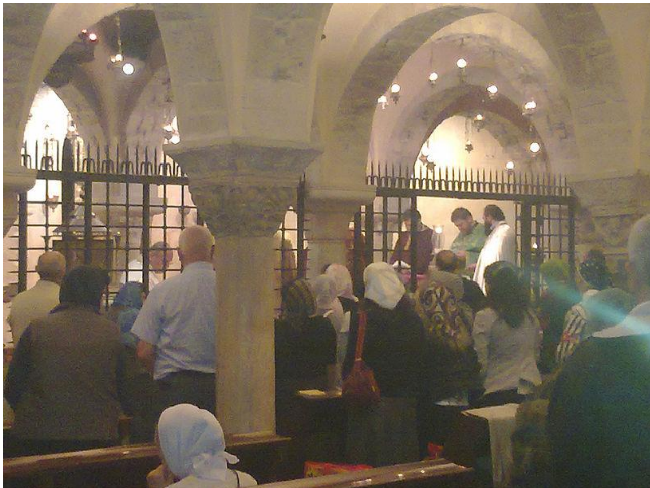
Bari, Basílica de San Nicolás, cripta. (GNU Free Documentation License)

Se accede a la cripta a través de una escalera puesta sobre la nave lateral que dirige al devoto en una dimensión mística, gracias a la profusión de iconos, lámparas, ornamentos en metales preciosos, tejidos y bordados que contribuyen a hacer enormemente sugestiva la visión de las reliquias de San Nicolás, aquí conservadas.