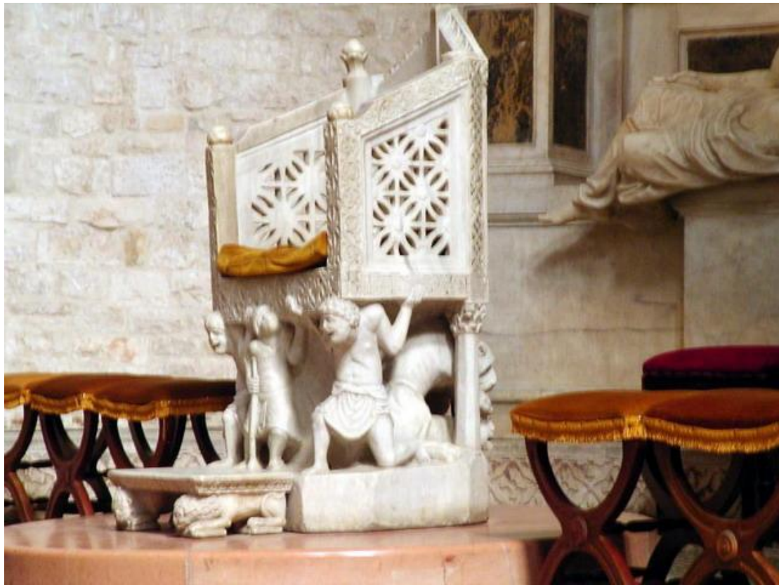
Bari, Basílica de San Nicolás, interior, cátedra del abad Elia.

expresionismo románico de los atlantes que sustentan la cátedra, retratados con la cara deformada por el esfuerzo y el peso del pecado.