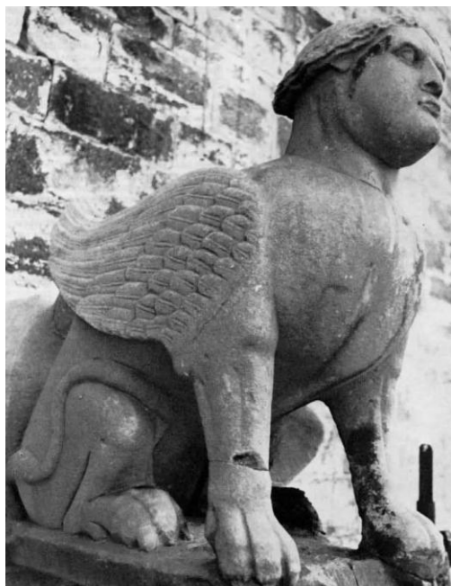
Bari, Basílica de San Nicolás, Esfinge esculpida sobre el ventanal del ábside, particular.

En realidad la posición de la basílica de san Nicolás, a pesar de la leyenda, no es en absoluto casual, sino que responde a precisas exigencias simbólicas y políticas. La nueva iglesia palatina tenía que surgir allí donde surgía el palacio del Catapano, para indicar que ahora el Santo patrón y, con él, los señores normandos que habían patrocinado la construcción de la iglesia, iban a ocupar el sitio y el papel que un tiempo había sido de los bizantinos; además, la posición cerca del mar tenía que enfatizar la estrecha relación de la ciudad con el Adriático. Por eso, la zona del ábside de la basílica, orientada hacia el mar, es tratada como si fuera una segunda fachada, con un ventanal muy grande decorado por animales esculpidos. Se trata de elefantes y esfinges, que además de sus significados simbólicos, aluden al Oriente hacia el que se dirigían o desde el que volvían los peregrinos y mercantes que se embarcaban a Bari bajo la protección de San Nicolás.