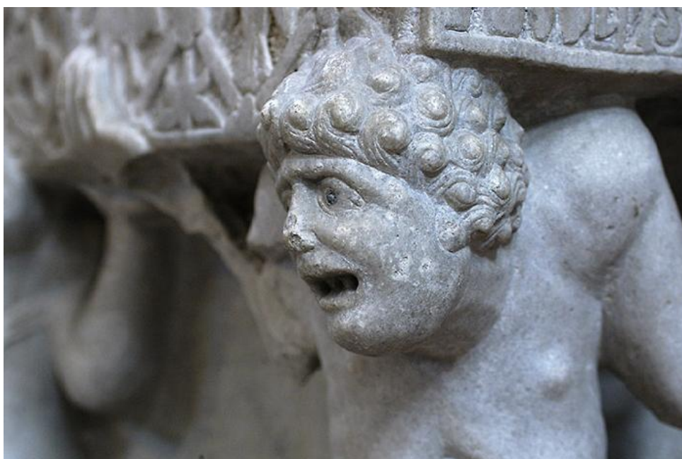
Bari, Basílica de San Nicolás, interior, cátedra del abad Elia, particular.

En este solemne marco románico se enfrentan, en un sugestivo contraste, la refinada art de cour trasplantada del Ile de France por los angevinos, que sucedieron a los normandos y a los suevos a la guía de la ciudad y el esplendor oriental, de gusto todo bizantino de la cripta llena de ornamentos lujosos e iconos. (M. S. Calò Mariani, L'immagine ed il culto di san Nicola a Bari e in Puglia ).