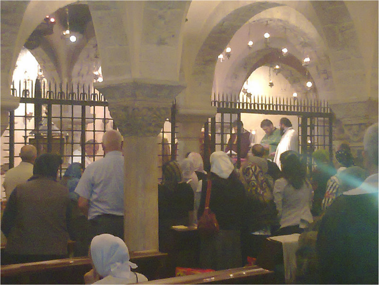
Bari, Basílica de San Nicolás, cripta.