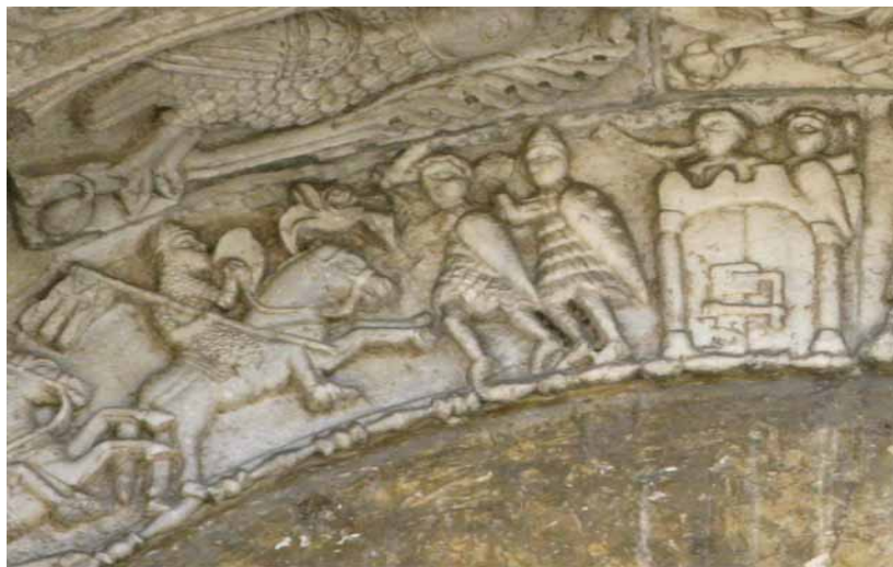
Bari, Basilika San Nicola, Portal der Löwen , 12. Jhd., Detail.

Mediterrane Züge weisen hingegen die Skulpturen zweier säulentragender Ochsen auf. Sie dekorieren das Prothyron des Hauptportals der Basilika und wurden von einem anonymen Bildhauer gemeißelt: Diese Skulpturen verbinden die Ornamente der lokalen klassischen Tradition mit völlig romanischen und europäischen Elementen.