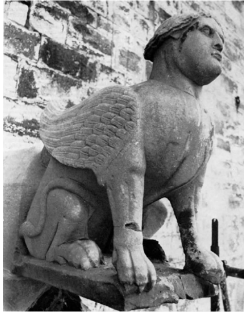
Bari, Basilika San Nicola, Sphinx auf dem Apsidialfenster, Detail.

Tieren: Elefanten und Sphingen, die mit ihren symbolischen Bedeutungen auf den Osten anspielten. Dort gingen und von dort kamen Pilger und Händler zurück, nachdem sie zum heiligen Nikolaus gebetet hatten.