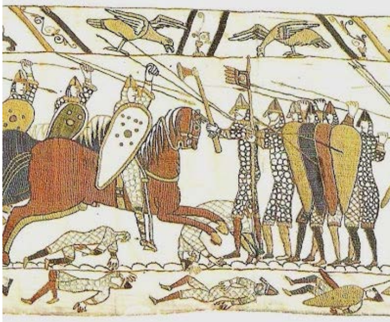
Wandteppich von Bayeux , 11. Jhd., Centre Guillaume-le-Conquérant von Bayeux, Detail.