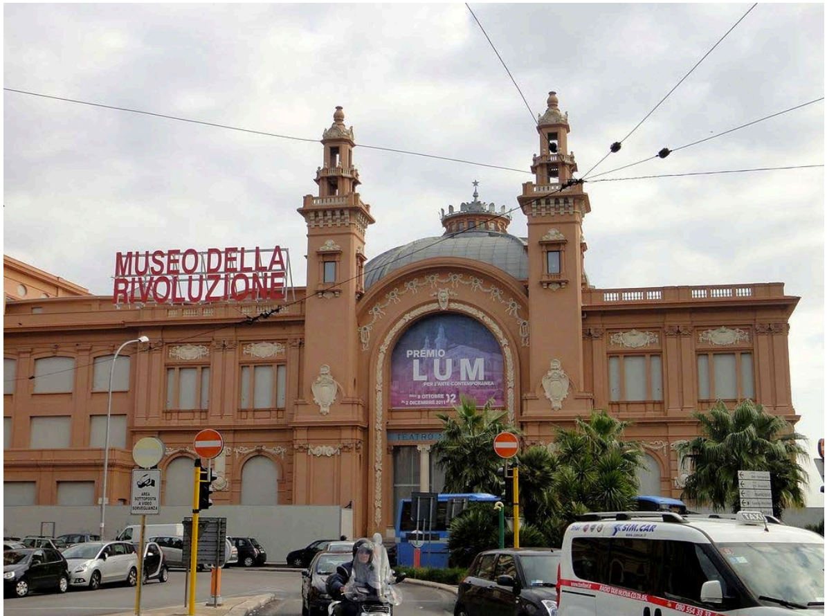
Bari, Teatro Margherita