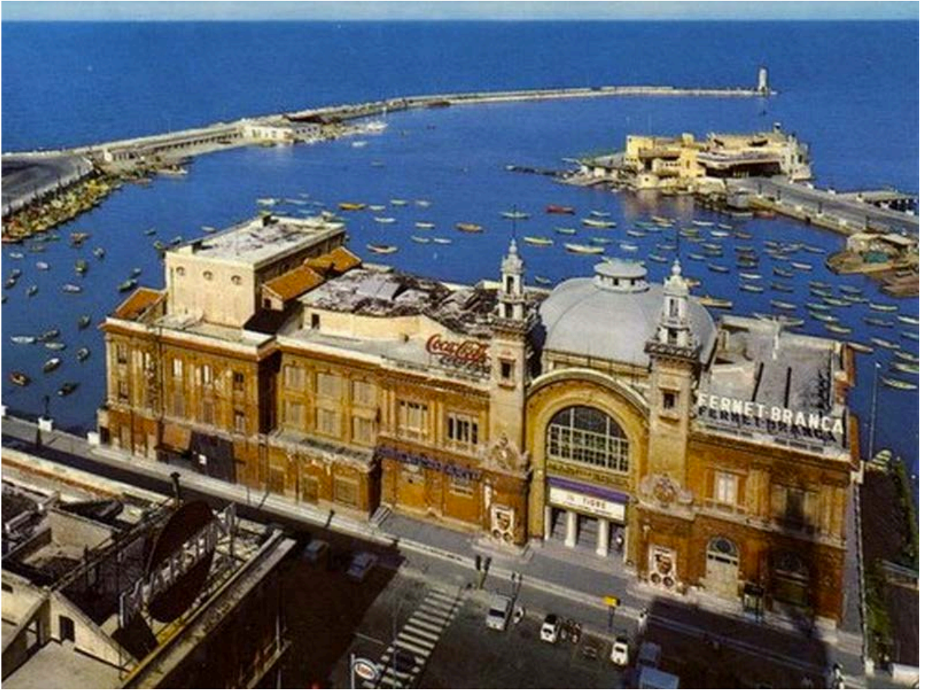
Bari, Teatro Margherita