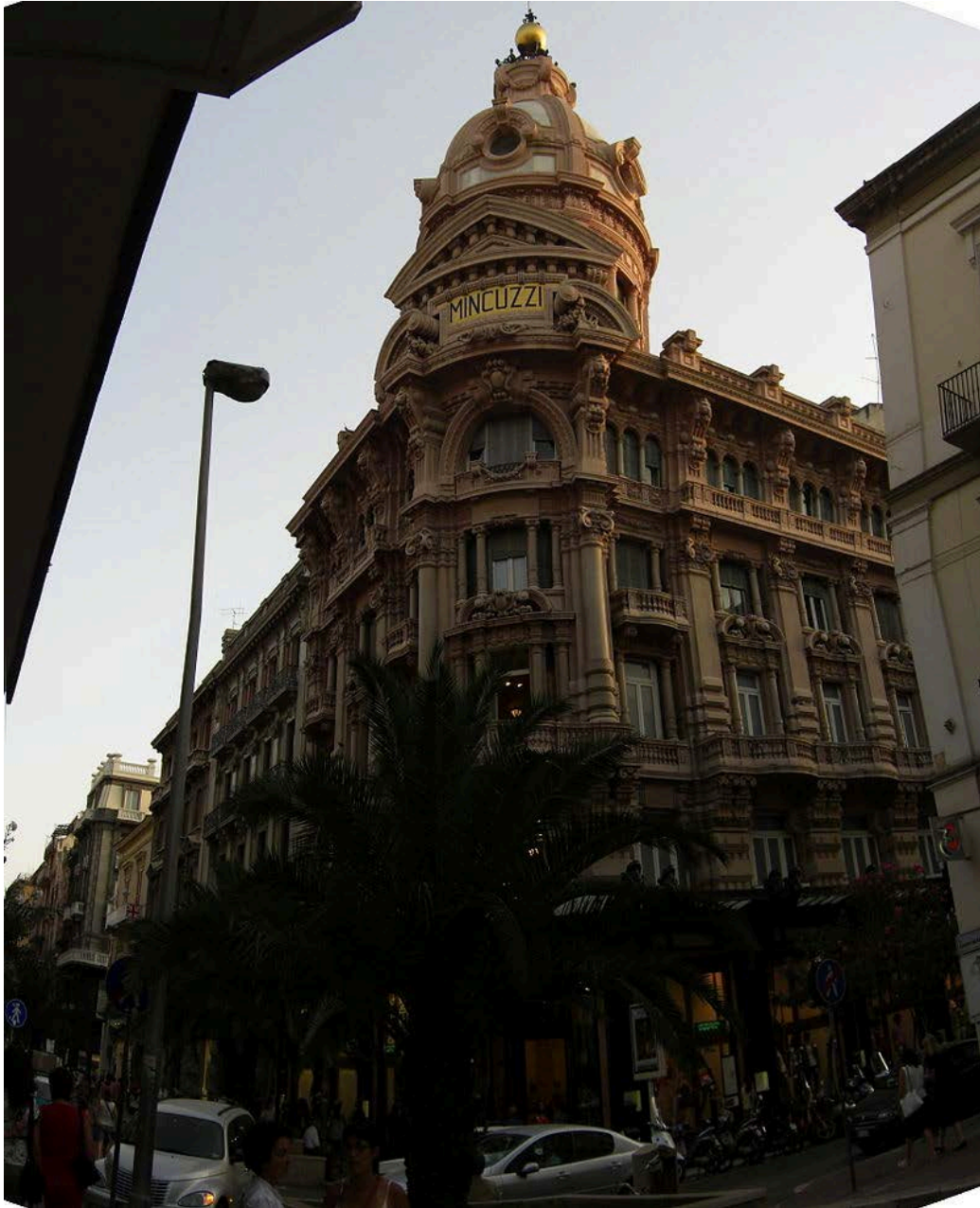
Bari, Palazzo Mincuzzi