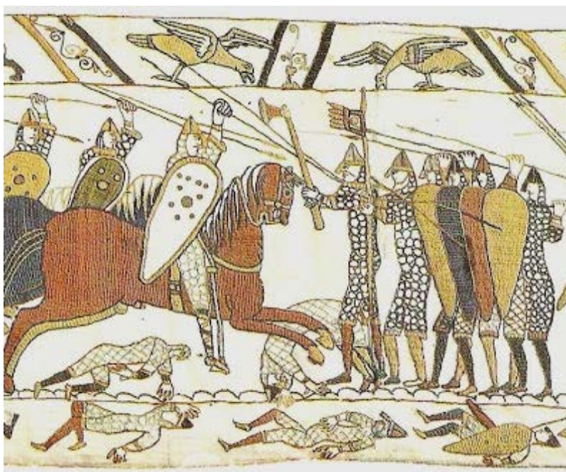
Tapiz de Bayeux , siglo XI, hoy expuesto en el Centre Guillaume-le-Conquérant di Bayeux, particular.

Se puede observar especialmente el portal, llamado de los leones, que se abre por el lado izquierdo de la basílica, exactamente bajo el primer de los arcos laterales. Por la arquivolta está contada, a través de la escultura, la epopeya de los Normandos, nuevos señores de Bari. Con un ductus de extraordinaria felicidad narrativa y propagandística, las refinadas tramas del tapiz de Bayeux parecen tomar nueva vida y nuevas formas en estas esculturas, desembarcadas a la ciudad para contar las historias de los señores del norte a los nuevos súbditos meridionales.