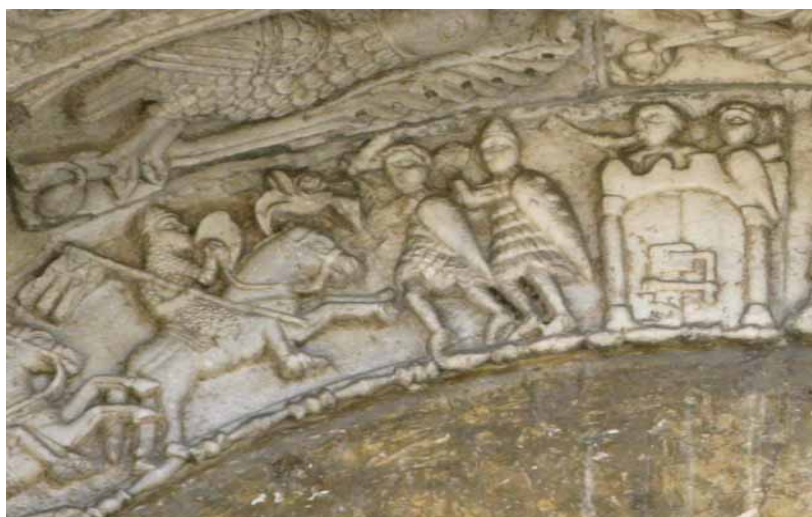
Bari, Basílica de San Nicolás, portal de los leones , siglo XII, particular.