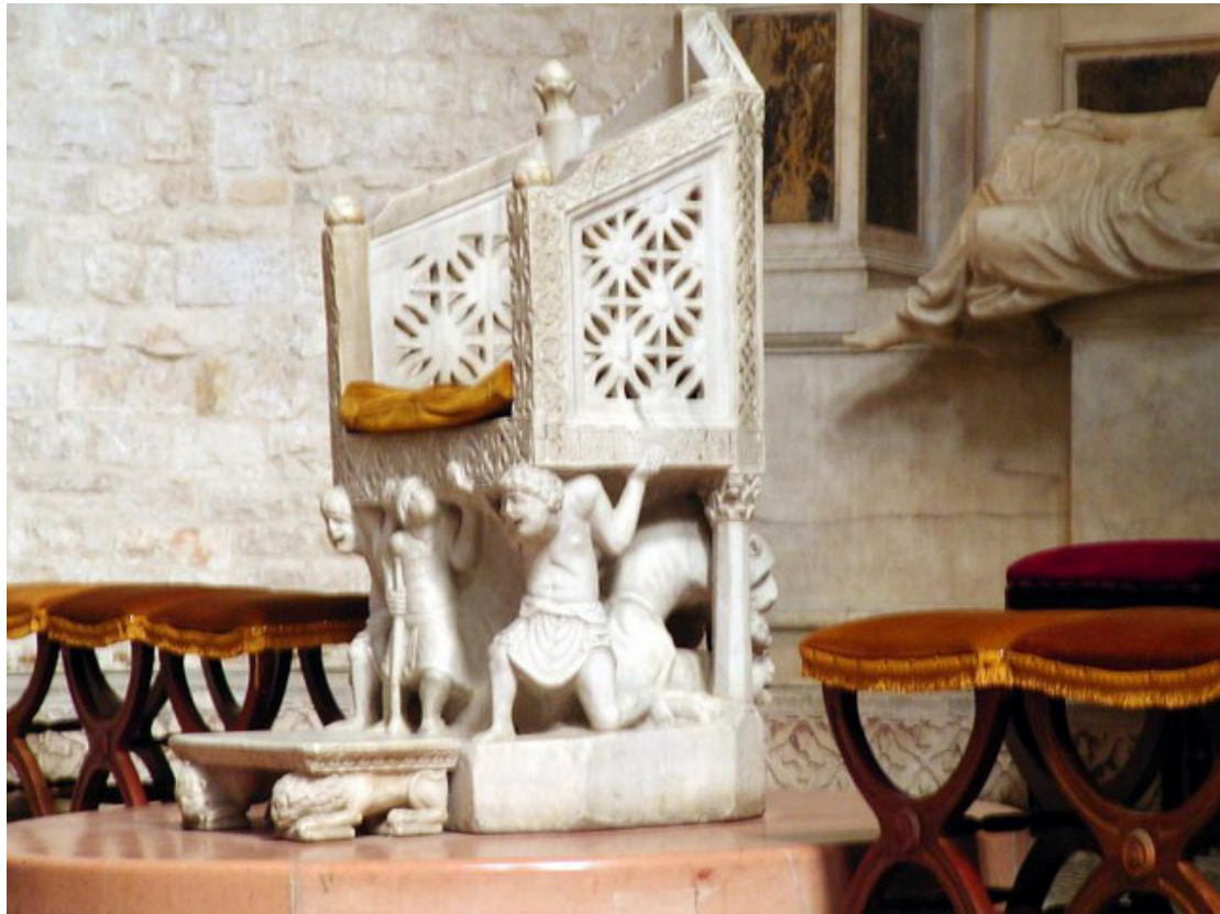
Bari, Basílica de San Nicolás, interior, cátedra del abad Elia.

decorativas, con el expresionismo románico de los atlantes que sustentan la cátedra, retratados con la cara deformada por el esfuerzo y el peso del pecado.