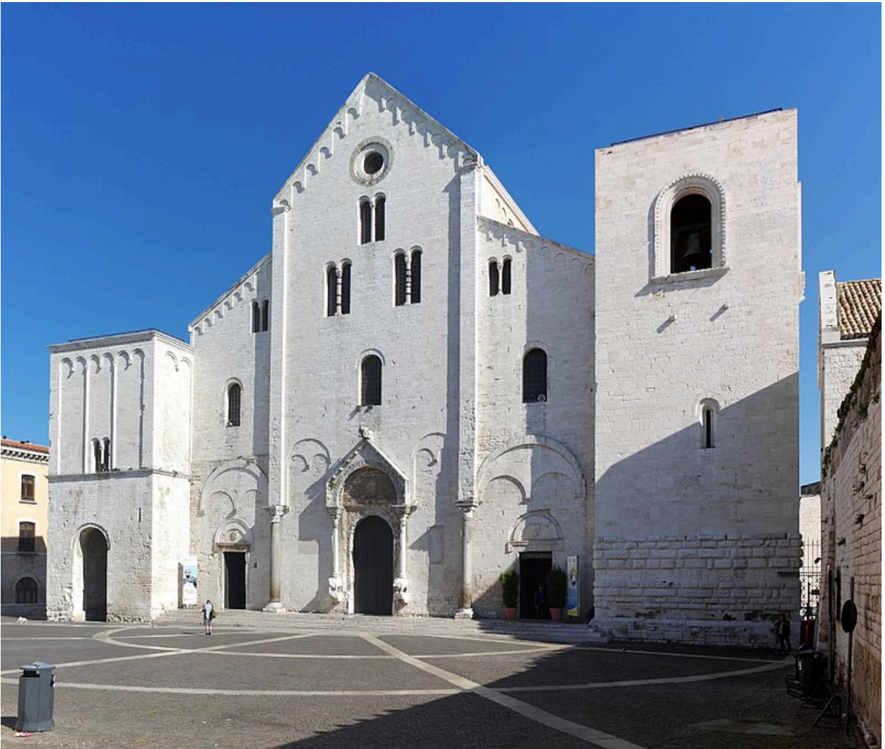
Bari, Basílica de San Nicolás

La Basílica de San Nicolás, querida por el abad benedictino Elia en 1089, fue consagrada en 1197. El culto abad quiso realizar un edificio que en sí mismo pudiera resumir numerosas funciones y diferentes significados. Tenía que ser una iglesia de peregrinación, la iglesia madre de los habitantes de Bari y un punto de referencia para los que llegaban desde el mar e inmediatamente se enfrentaban con el gálibo sobresaliente desde sus torres.