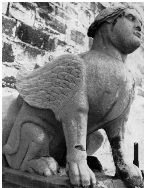
Bari, Basílica de San Nicolás, Esfinge esculpida sobre el ventanal del ábside, particular.

En realidad la posición de la basílica de san Nicolás, a pesar de la leyenda, no es en absoluto casual, sino que responde a precisas exigencias simbólicas y políticas. La nueva iglesia palatina tenía que surgir allí donde surgía el palacio del Catapano, para indicar que ahora el Santo patrón y, con él, los señores normandos que habían patrocinado la construcción de la iglesia, iban a ocupar el sitio y el papel que un tiempo había sido de los bizantinos; además, la posición cerca del mar tenía que enfatizar la estrecha relación de la ciudad con el Adriático. Por eso, la zona del ábside de la basílica, orientada hacia el mar, es tratada como si fuera una segunda fachada, con un ventanal muy grande decorado por animales esculpidos. Se trata de elefantes y esfinges, que además de sus significados simbólicos, aluden al Oriente hacia el que se dirigían o desde el que volvían los peregrinos y mercantes que se embarcaban a Bari bajo la protección de San Nicolás.