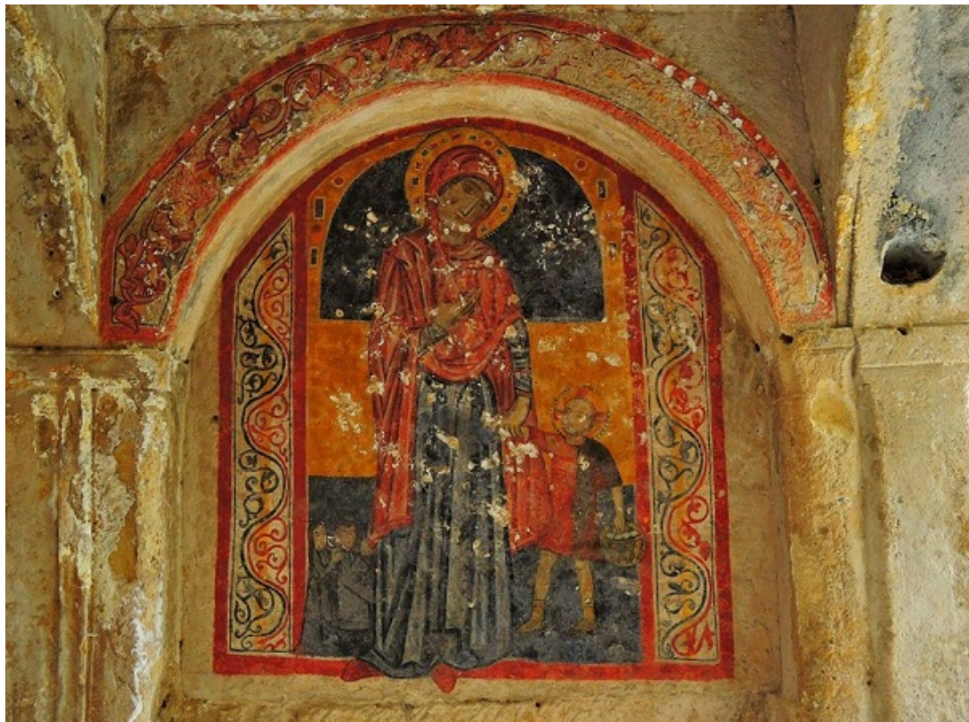
Cripta de la Candelora, fresco de la Vérgine che conduce il Bambino

La Chiesa della Candelora se asoma directamente a la Gravina de San Marco y se encuentra dentro de un jardín privado accesible recorriendo Via Canali. La Cripta con tres naves, a pesar de algunos derrumbes que han comprometido la originaria entrada y una parte de la zona del ábside, mantiene los tejados con falsas albardillas y cúpulas. Las paredes, de las que se abren varias arcadas, acogen frescos de una belleza poco común y datan de los siglos XIII-XIV. Estas pinturas están acompañadas por inscripciones griegas y latinas que testimonian la polifonía cultural de la región, puente entre el Oriente greco-bizantino y el Occidente latín. Extraordinariamente sugestivo es el fresco de la Vérgine che conduce il Bambino . Se trata de una iconografía muy rara que parece querer exaltar la ternura materna de María que casi va fuera del espacio del cuadro – se pueden notar los pies que antes del suelo, tocan el plan de pisoteo - y parece dirigir premurosas recomendaciones a su hijo que tiene una cesta con huevos que han sido de varias formas interpretados. En la simbología cristiana el huevo puede aludir a la Pasión, dado que es una metáfora de un sepulcro desde el que nace la vida. Al lado de la Virgen, las dos figuras más pequeñas representan los cónyuges ordenantes del fresco.