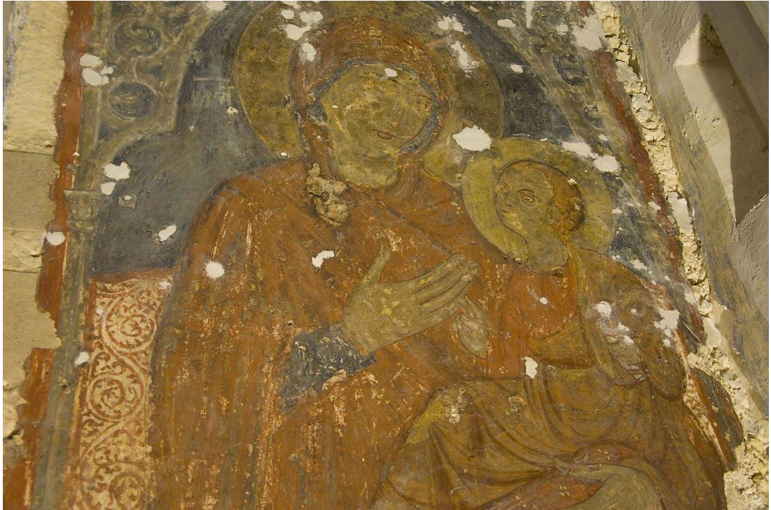
Santuario de la Madonna della Scala, Madonna con Bambino