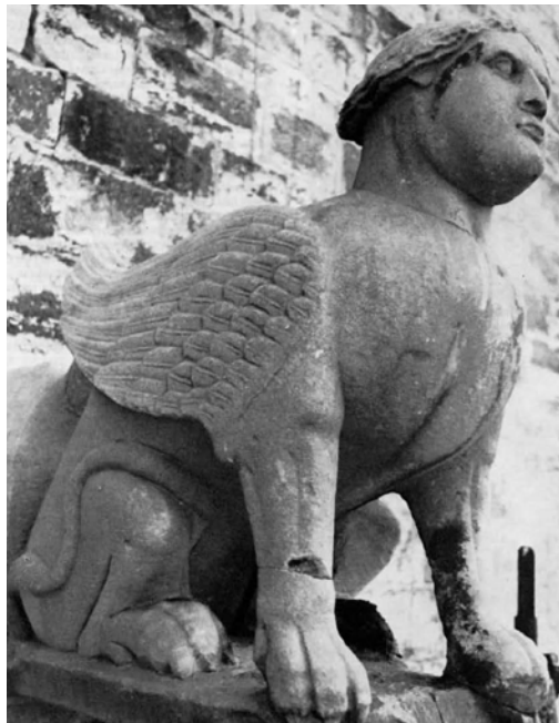
Bari, Basilika San Nicola, Sphinx auf dem Apsidialfenster, Detail.

Tatsächlich ist die Lage der Basilika keineswegs zufällig, sondern sie erfüllt einen spezifischen symbolischen und politischen Bedarf. Die neue palatinische Kirche sollte dort liegen, wo der Palast des Katepans lag: So wurde gezeigt, dass der Schutzheilige und die normannischen Herren, die den Bau der Kirche gefördert hatten, die Stelle und die Rolle der Byzantiner übernommen hatten. Darüber hinaus sollte sich die Lage am Meer erheben, um die enge Beziehung der Stadt zu der Adria zu unterstreichen. Daher scheint der Apsidialbereich der Basilika, die auf das Meer gerichtet ist, fast eine zweite Fassade zu sein, mit einem riesigen Fenster mit gemeißelten Tieren: Elefanten und Sphingen, die mit ihren symbolischen Bedeutungen auf den Osten anspielen, wovon Pilger und Händler reisten und wohin sie zurückkehrten, nachdem sie zum hl. Nikolaus gebetet hatten.