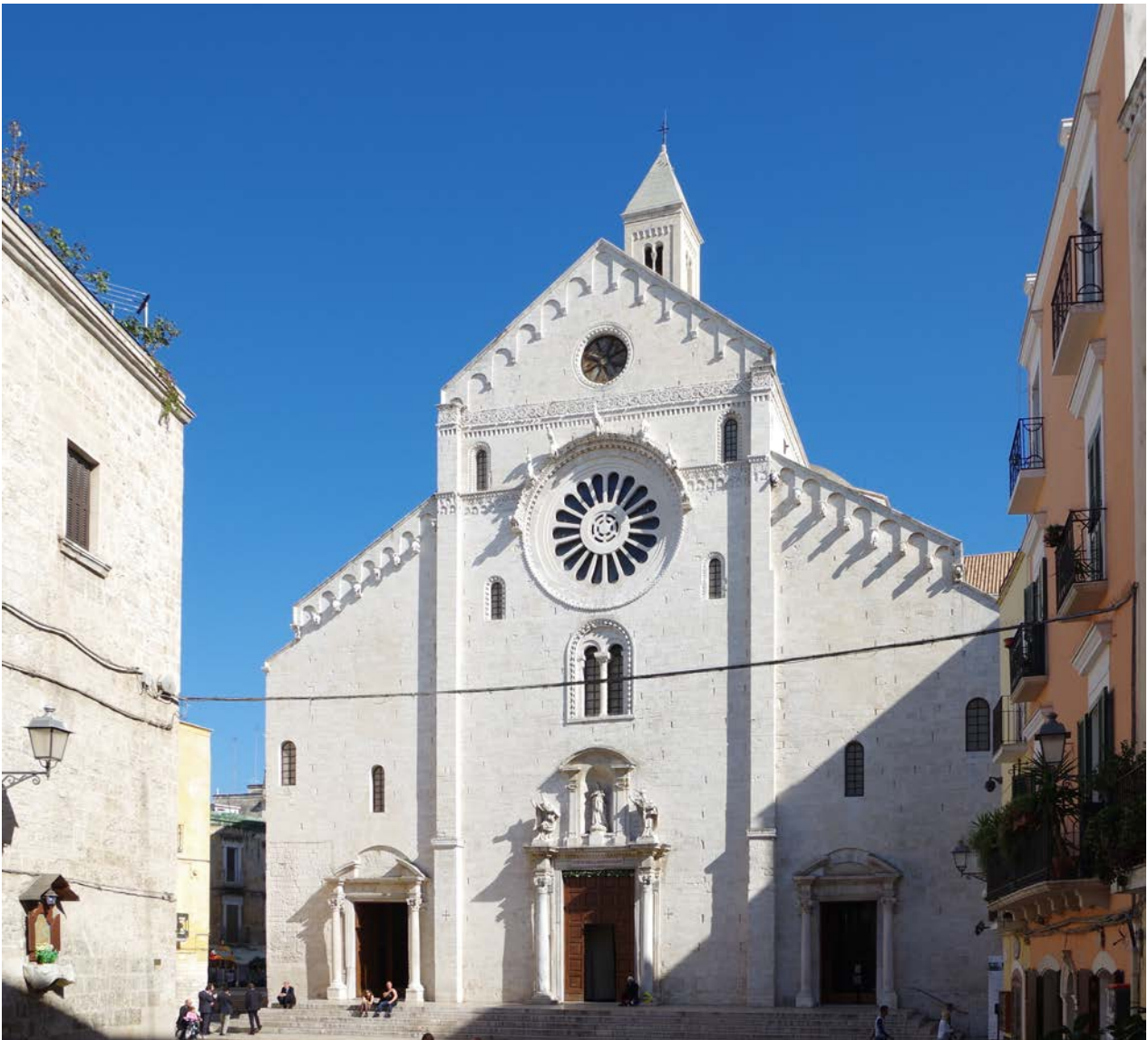
La Catedral de Bari de San Sabino