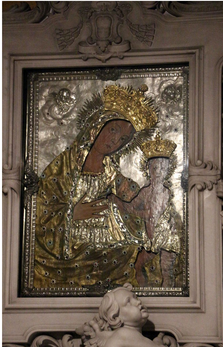
Icono de la Virgen Ho digitria