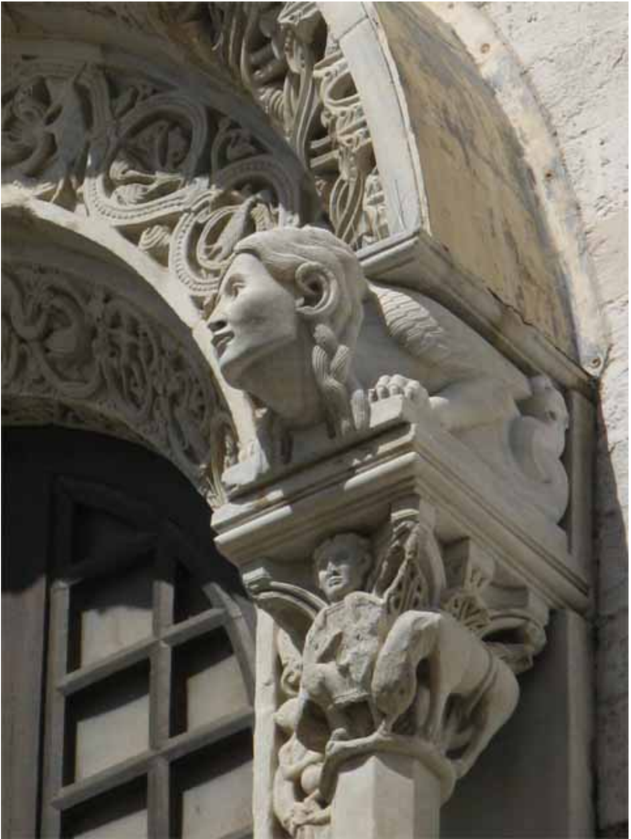
Bari, Catedral, fachada posterior, particular del ventanal del ábside.

La fantástica decoración plástica románica del exterior contrasta con la atmósfera austera y mística del interior, donde el silencio de las profundas naves está ritmado solo por un solemne juego de columnatas que contrasta con las elegantes triforas de los matroneos superiores.