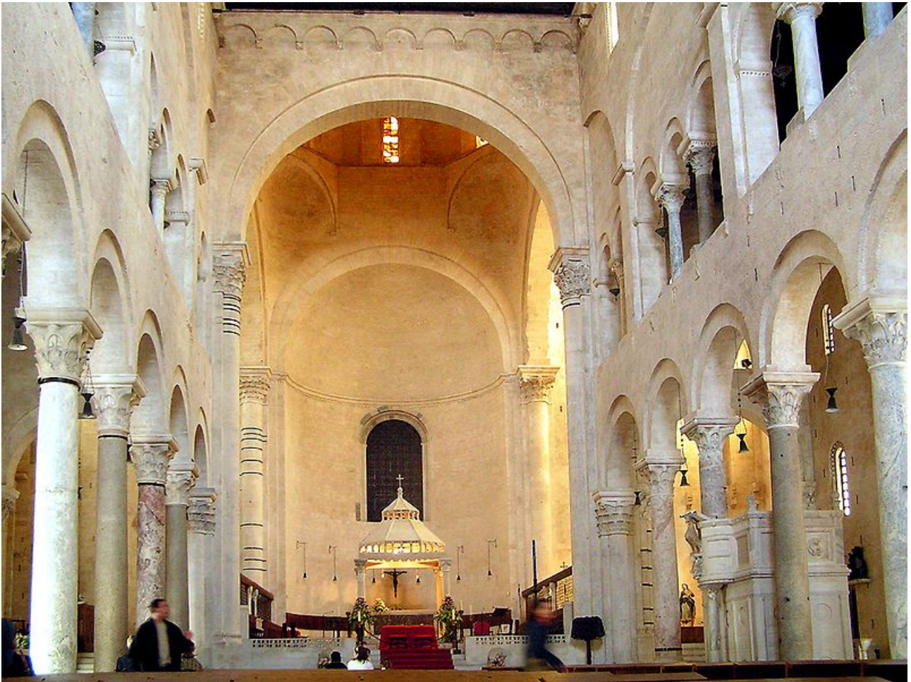
Bari, catedral de San Sabino, interior.