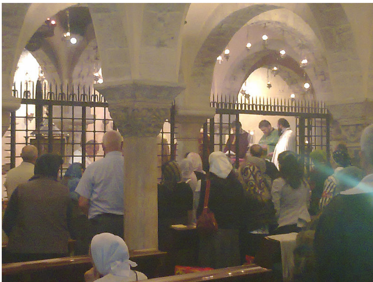
Bari, Basilika San Nicola, Krypta.