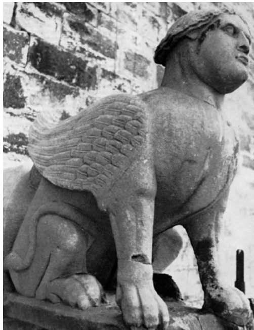
Bari, Basilika San Nicola, Sphinx auf dem Apsidialfenster, Detail.

Tatsächlich ist die Lage der Basilika keineswegs zufällig, sondern sie erfüllt einen spezifischen symbolischen und politischen Bedarf. Die neue palatinische Kirche sollte dort liegen, wo der Palast des Katepans lag: So wurde gezeigt, dass der Schutzheilige und die normannischen Herren, die den Bau der Kirche gefördert hatten, die Stelle und die Rolle der Byzantiner übernommen hatten. Darüber hinaus sollte sich die Lage am Meer erheben, um die enge Beziehung der Stadt zu der Adria zu unterstreichen. Daher scheint der Apsidialbereich der Basilika, die auf das Meer gerichtet ist, fast eine zweite Fassade zu sein, mit einem riesigen Fenster mit gemeißelten Tieren: Elefanten und Sphingen, die mit ihren symbolischen Bedeutungen auf den Osten anspielen, wovon Pilger und Händler reisten und wohin sie zurückkehrten, nachdem sie zum hl. Nikolaus gebetet hatten.