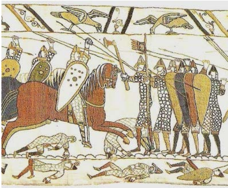
Wandteppich von Bayeux , 11. Jhd., Centre Guillaume-le-Conquérant von Bayeux, Detail.

mit seiner Lage und seinen zwei kräftigen Türmen an die großen romanischen Kathedralen des Nordens erinnert. Dennoch sind die Ausmaße der Kuppeln und der Gewölbe in gradlinigen Strukturen enthalten, nach der nahöstlichen Bautechnik und der langen apulischen Tradition. Zahlreiche Pilger kamen hier, um die Überreste des hl. Nikolaus zu verehren. Deshalb, um den Zustrom der Pilger zu erleichtern, gibt es insgesamt fünf Portale, die mit Skulpturen dekoriert sind. In diesen Kunstwerken treffen sich die formale Schönheit und der didaktische Reichtum der Gehalte. Der schmückende und plastische Apparat der Basilika San Nicola weist den Reichtum und die Mannigfaltigkeit der apulischen Romanik auf: Die Reisenden bestaunen Fantasiewelten mit monstra aus den nördlichen Tierbüchern und sorgfältige klassische Verweise mit Ornamenten islamischer Herkunft, die den Stoffen und Wertgegenständen der nach Apulien kommenden Pilger und Händler entnommen wurden. Außerordentlich ist das sogenannte Portal der Löwen, auf der linken Seite der Basilika, ausgerechnet unter dem ersten Seitenbogen. An der Archivolte sind die Heldentaten der Normannen, der neuen Herren von Bari, gemeißelt. Diese Reliefe hatten einen erzählenden und propagandistischen Zweck und scheinen, mit den feinen Schüssen des Wandteppichs von Bayeux verbunden zu sein. Auf jeden Fall sollten sie den neuen südlichen Untertanen die Taten der Herrscher des Nordens erzählen.