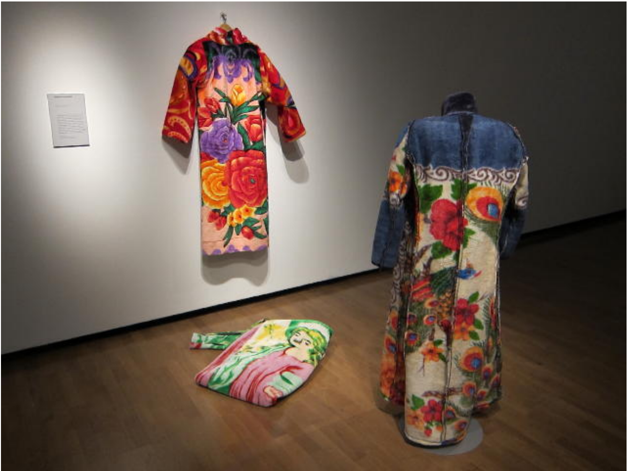
The Fabric of Life, Roma-Gypsy Fashion at the Royal Academy of Arts, London, 2010