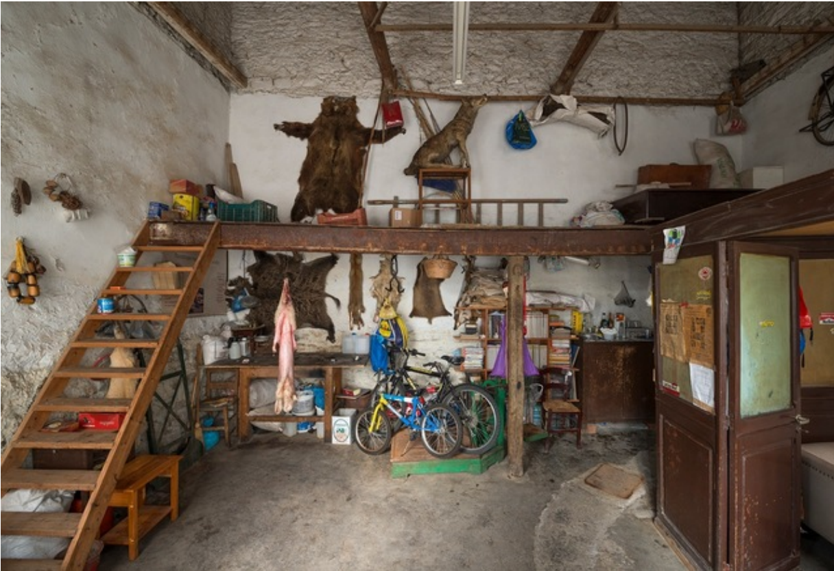
“Why look at animals? AGRIMIKA”, 56 th Venice Biennale, 2015