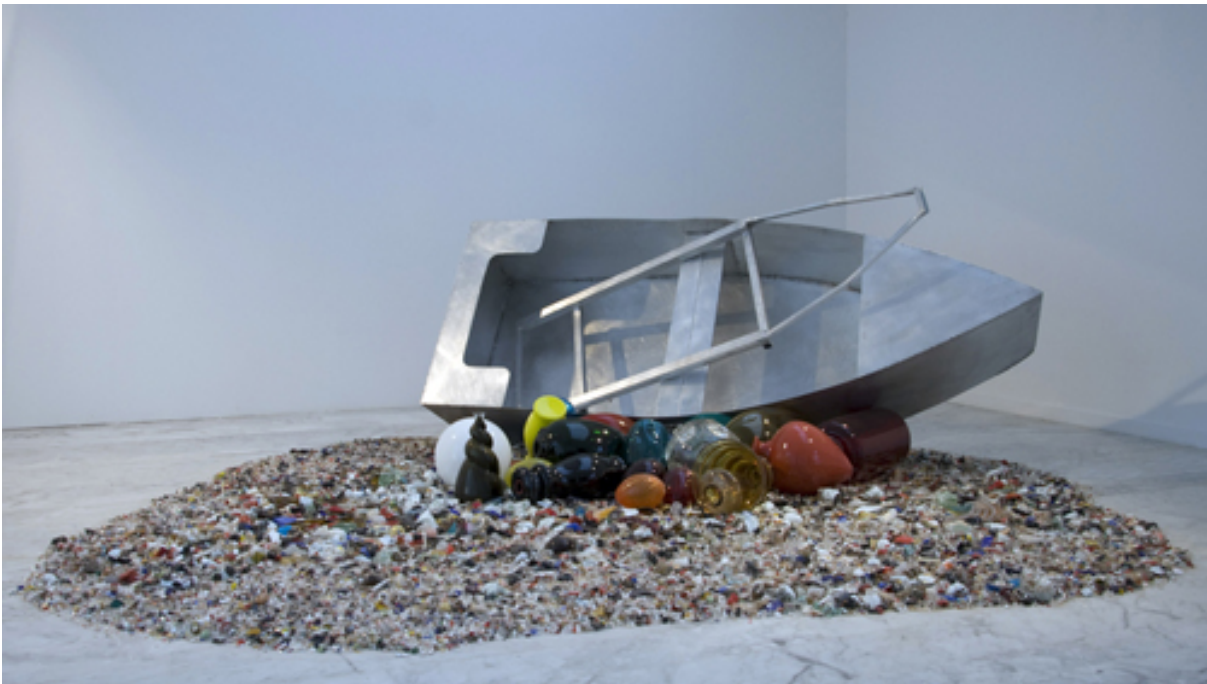
Thessaloniki Biennale of Contemporary Art, 2013–2014