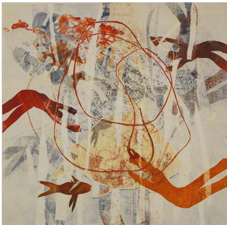
ισορροπίες, βαθυτυπία, υψιτυπία (μονοprint), 40x40 cm, 2007