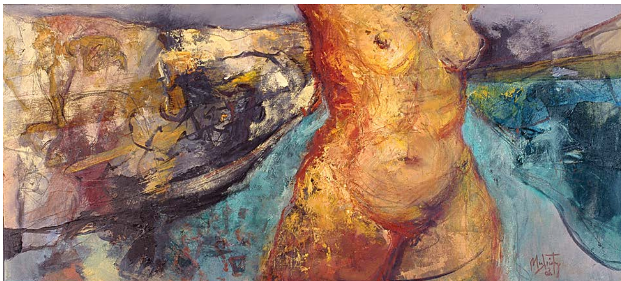
πέταγμα, λάδι σε καμβά, 45x100 cm, 2004