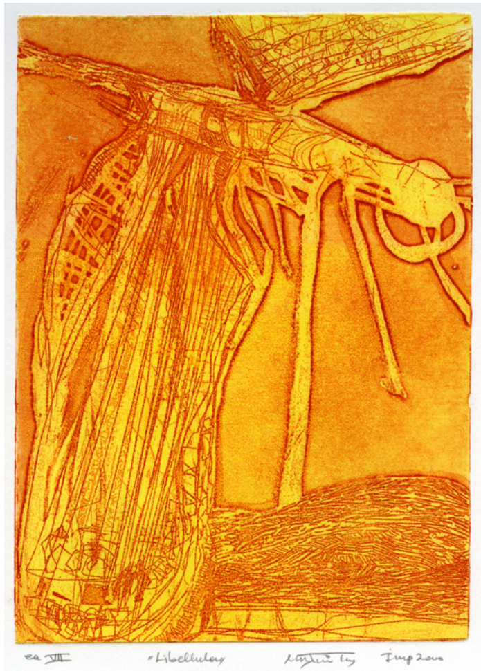
Libellula, οξυγραφία, 23x17cm, 2000