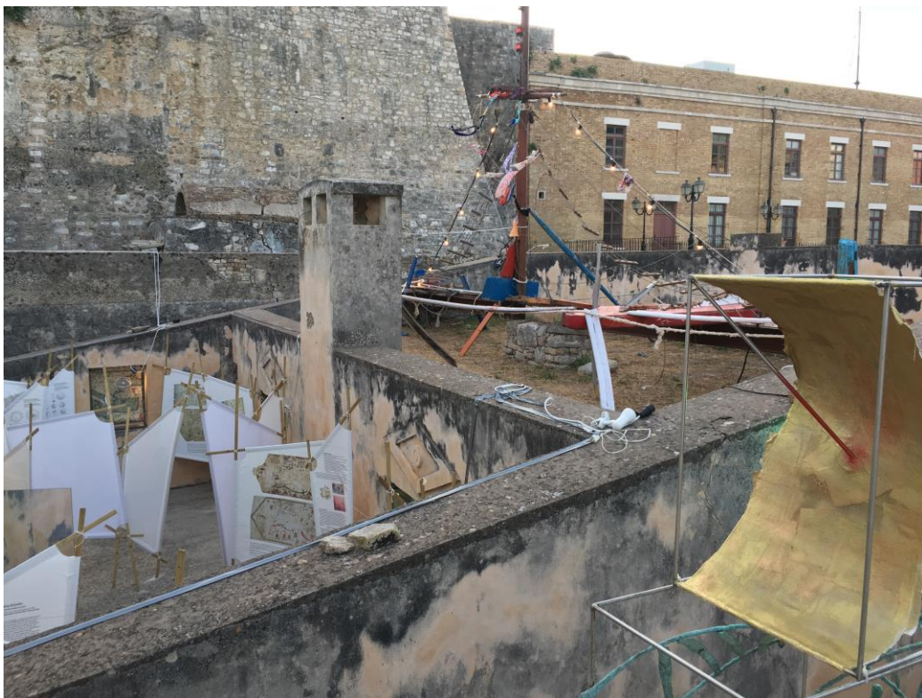
Φαίνονται οι in situ εγκαταστάσεις από αριστερά προς τα δεξιά: 'Ιστία' (Ε. Τσακίρη), Ανασύστασις (Δ. Ευθυμίου) και Πέρασμα (Οι 5)