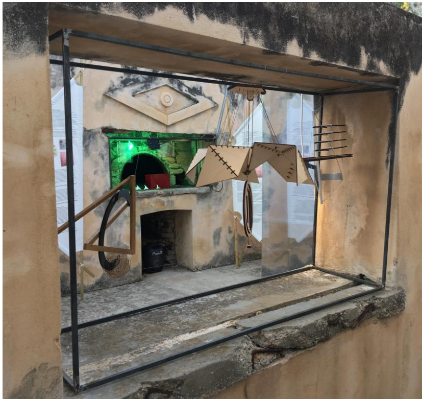
Φαίνονται: μπροστά Navigational Metamorphosis μέρος εγκατάστασης φοιτητών σχολής Αρχιτεκτόνων Μηχανικών ΠΚ, διδάσκ. Επίκ. καθηγητής Σ. Γιαννούδης και πίσω 'Σπινθήρες μνήμης' μέρος εγκατάστασης φοιτητών σχολής Αρχιτεκτόνων Μηχανικών ΕΜΠ, διδάσκ. Επίκ. καθηγητής Ν. Κουρνιατίης