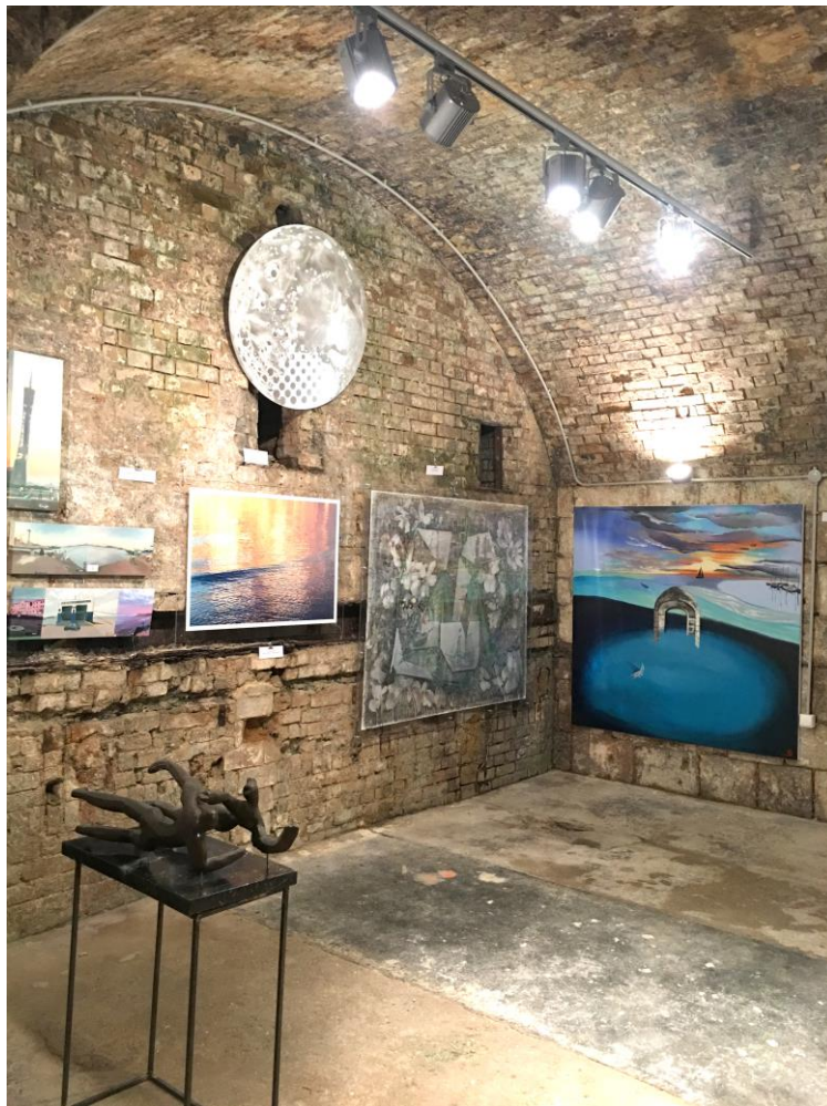
Αίθουσα 'Καινοτομία': Φαίνεται αριστερά το γλυπτό 'Σύμπλευσις' του Γ. Καλακαλλά, το τρίπτυχο 'Ο δρόμος του μεταξιού' της Α. Ζ. Σουλιώτου, πάνω το 'Σήμα της απόμακρης πλευράς της Σελήνης', από κάτω 'Ατιτλο' της Μ. Παπαδημητρίου, δεξιά 'Ανάπλους' της Η. Αγγελή και 'Αρχή-πέλαγος' της Λ. Κουτελιέρη.