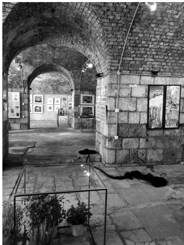
εγκατάσταση 'Ιστία' (Ε. Τσακίρη) από την αίθουσα 'Ταξίδι στην Μεγάλη Ελλάδα' (ομάδα uniwarch) και αίθουσα 'Μνήμη'