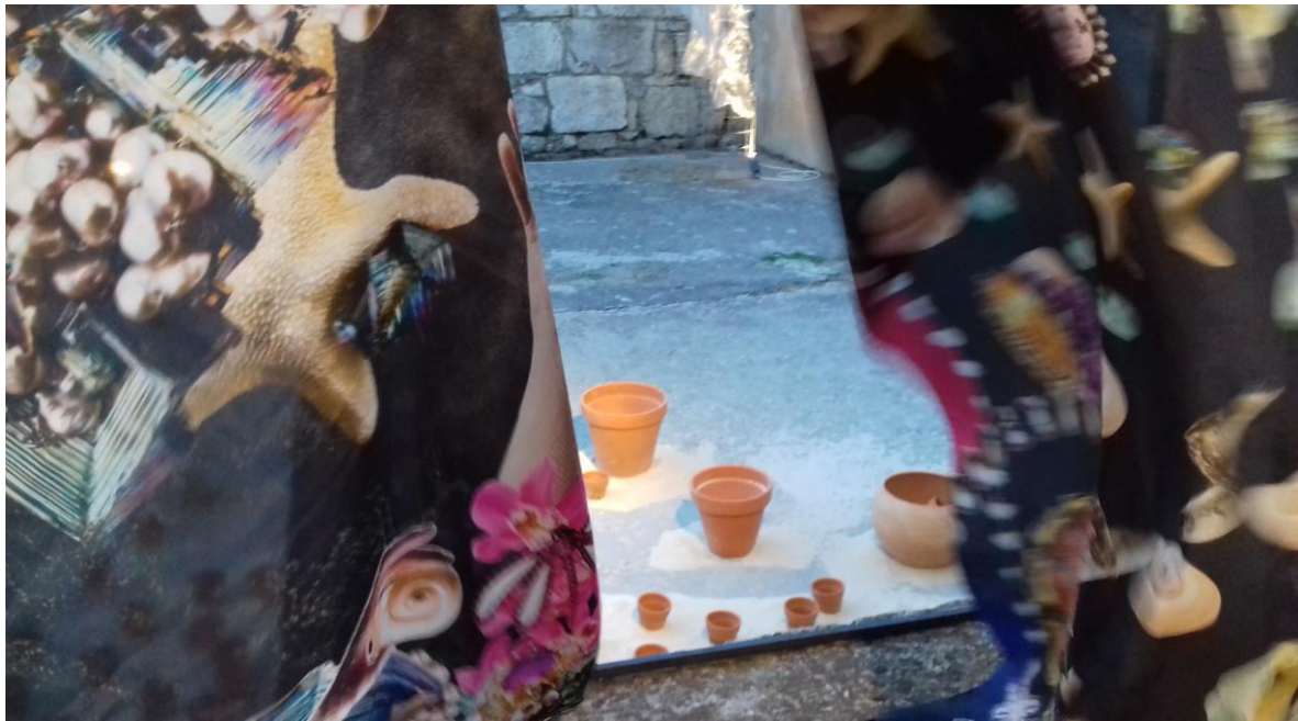
Μπροστά η εγκατάσταση 'Cosmic Plethora & The dancing Multiverse' της Λ. Λεβέντη και πίσω ο διαδραστικός χάρτης 'plus(+)ιονιο' από την ομάδα του διεπιστημονικού εργαστηρίου Λ. Μαντζουνέας, Γ. Χατζηδάκης, Ε. Τσακίρη.