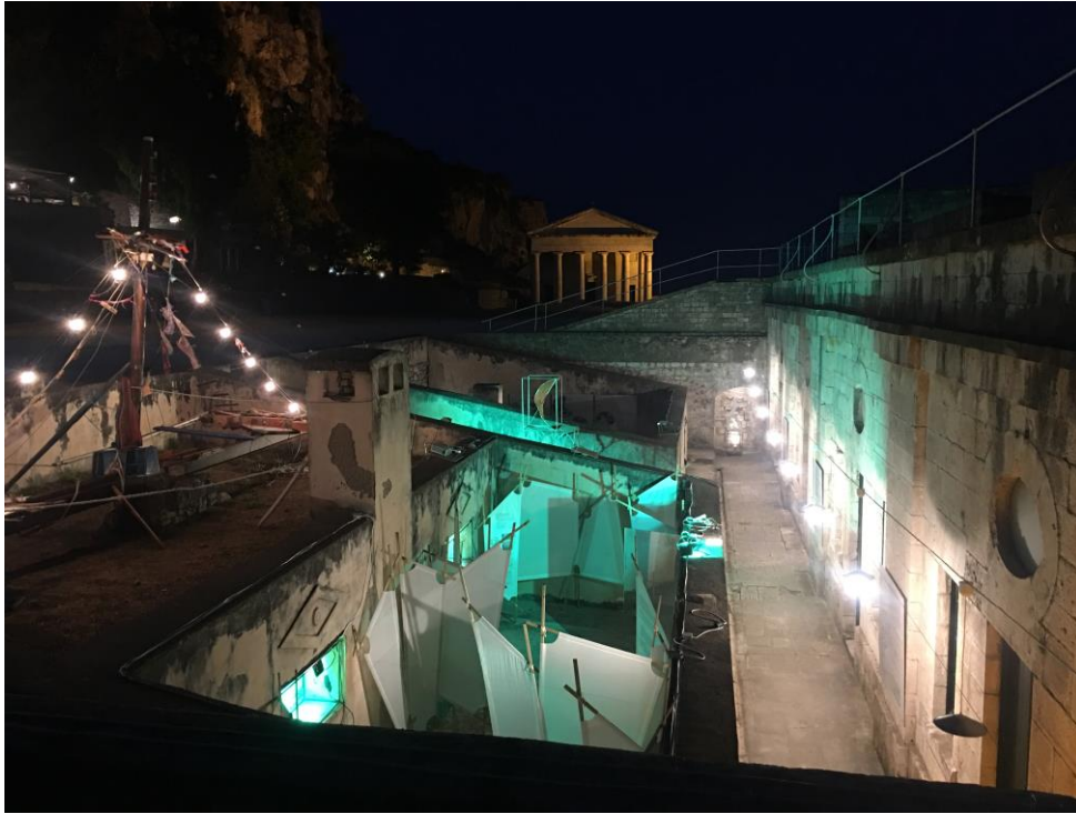
Βραδινή άποψη της έκθεσης ΑΠΟΠΛΟΥΣ