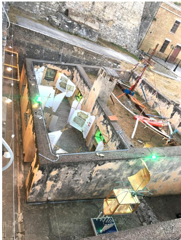
Εικόνα αριστερά: φαίνονται οι in situ εγκαταστάσεις: μπροστά αριστερά 'Ανασύστασις' (Δ. Ευθυμίου), κέντρο 'Ιστία' (Ε. Τσακίρη), πίσω 'Ταξίδι στο Ιόνιο' (Διεπιστημονικό εργαστήριο), βάθος 'Φύλακας' (Α. Καλακαλλάς)