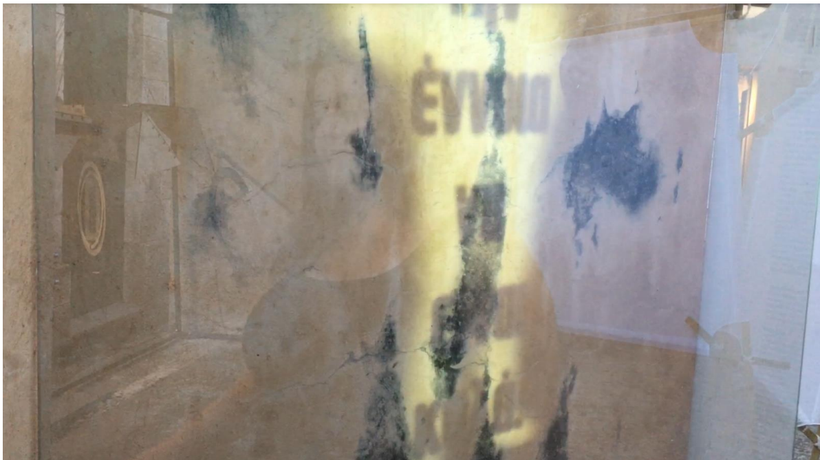
Στιγμιότυπο από το video 'Πόθος' (Ο. Βενετσιάνου, Ν. Κουρνιατής, Ε. Μανδουλίδου, Π. Πάνος) στην εγκατάσταση 'Αντικατοπτρισμός' (Ν. Κουρνιατής, Ε. Τσακίρη) στην αίθουσα της πολυμεσική εγκατάστασης 'Ταξίδι στο Ιόνιο' (ομάδα uniwarch)