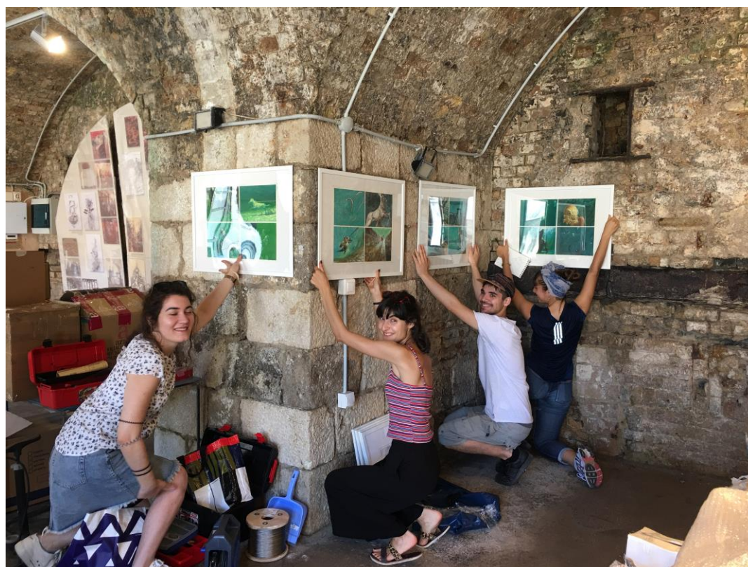
Φοιτητές του ΠΚ, ΕΜΠ, ΠαΔΑ και Erasmus που στήνουν το έργο 'Καπέλο από νερό' του Σ. Βερύκιου