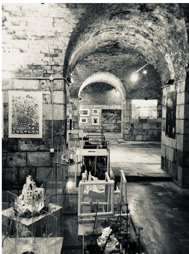
Ταξίδι στο Ιόνιο (αίθουσα διεπιστημονικού εργαστηρίου) και αίθουσα 'Αόρατες Πόλεις'