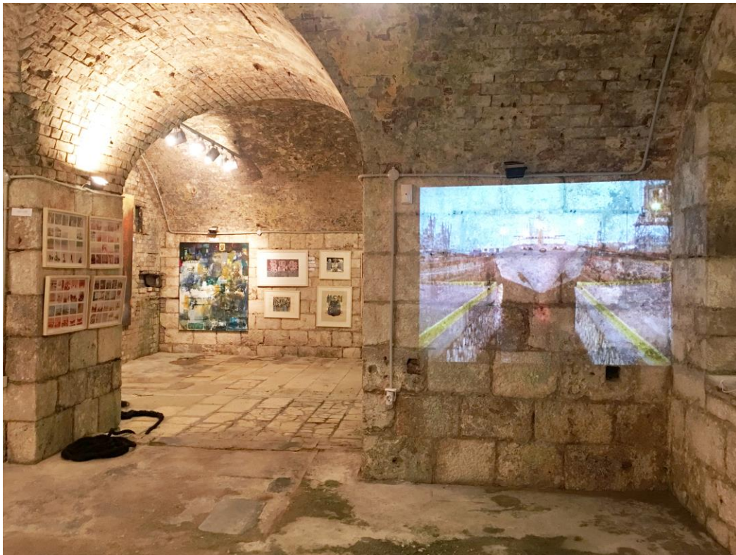
Αριστερά η εγκατάσταση "Όπως έγραφε μια παλιά διαφήμιση της Κόντακ: εσύ πατάς το κουμπί και η μηχανή κάνει τα υπόλοιπα" της Φ. Μουζακίτου, κέντρο βάθος αριστερά 'Στην κουβέρτα' του Γ. Αδαμάκη, δεξιά τα χαρακτηριστικά του Χ. Κατσαδιώτη και δεξιά η εγκατάσταση 'Ξηρά Ψυχή' του Α. Σιτορέγκο