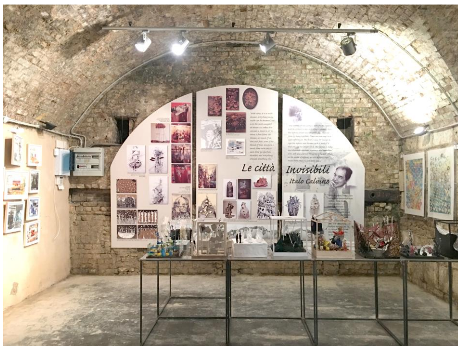
Αίθουσα 'Αόρατες Πόλεις': σε πρώτο πλάνο φαίνονται οι 'ορατοί κύβοι', οι εννοιολογικές κατασκευές των Αόρατων Πόλεων των φοιτητών του τμήματος Εσωτερικής Αρχιτεκτονικής του ΠαΔΑ, διδασκ. Ε. Τσακίρη, πίσω το τρίπτυχο με επιλεγμένους καλλιτέχνες από τον διεθνή χώρο που έχουν αναπαραστήσει εικαστικά τις Αόρατες Πόλεις του Italo Calvino στον τοίχο αριστερά το έργο 'Διαδρομές' της Κ. Ζαχαρίου, και δεξιά οι Αόρατες Πόλεις 'Ευτροπία' και 'Εσμεράλδα' της Ε. Τσακίρη.