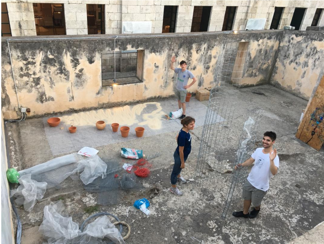
Φοιτητές που στήνουν τις εγκαταστάσεις για το διεπιστημονικό εργαστήριο στην αίθουσα 'Ταξίδι στο Ιόνιο'