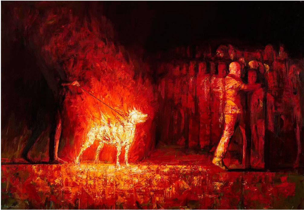
Burning dog 2, Oil on canvas, 80 cm X 116 cm (Selected work for the 6th Beijing Bienalle)