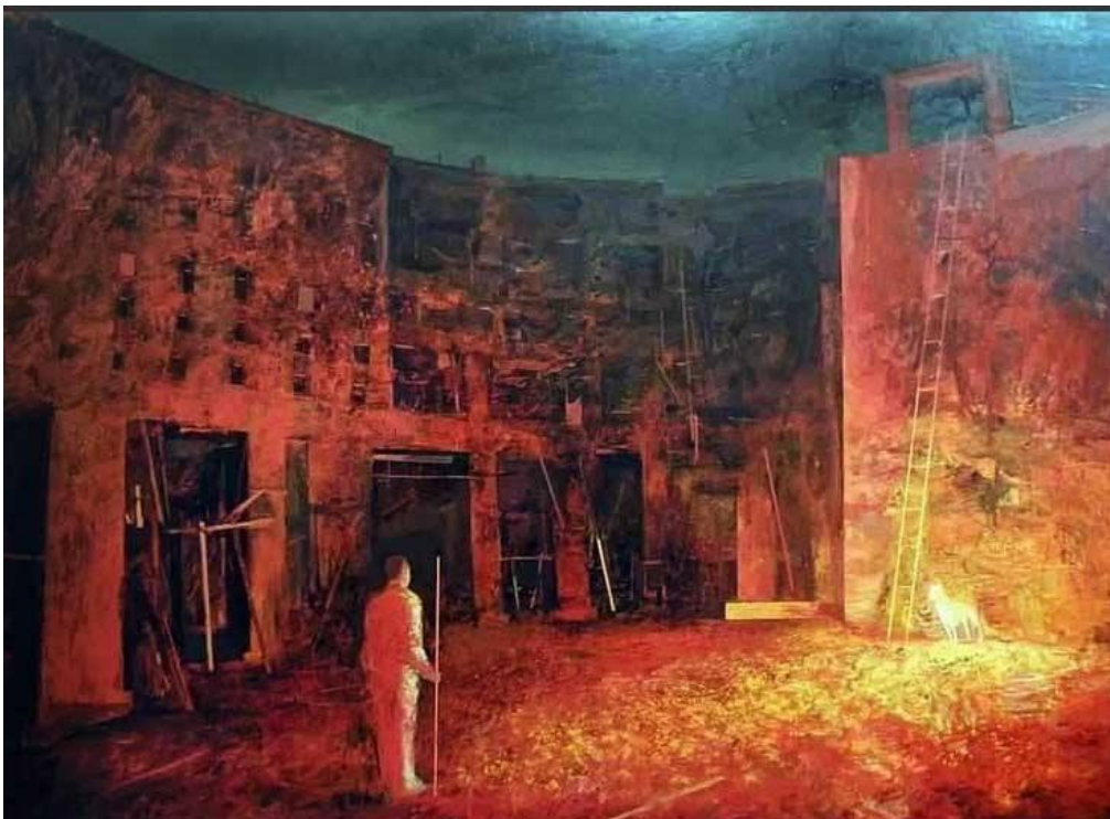
1997, λάδι σε μουσαμά