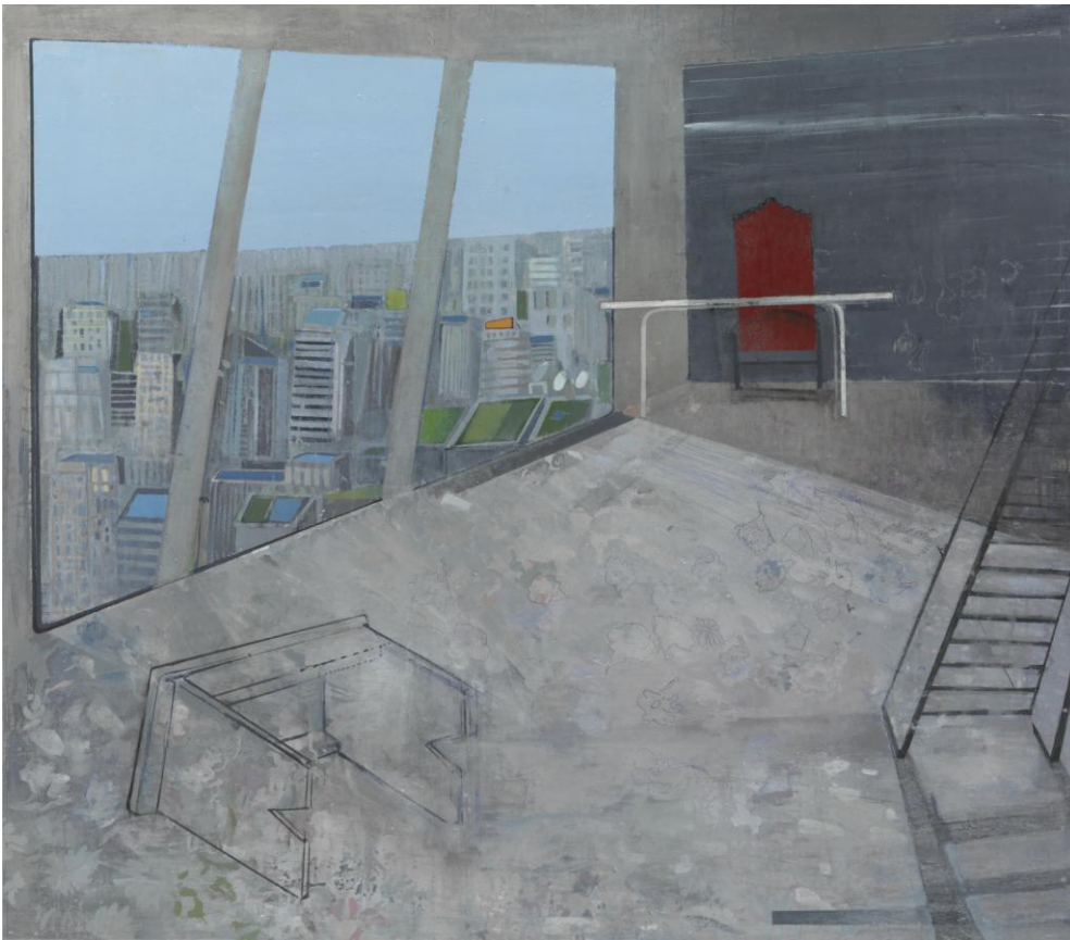
BOUNDARIES: "No Limits", Ink and acrylics on paper, 80 X 100 cm, Zoumboulakis Gallery, Athens, 2015