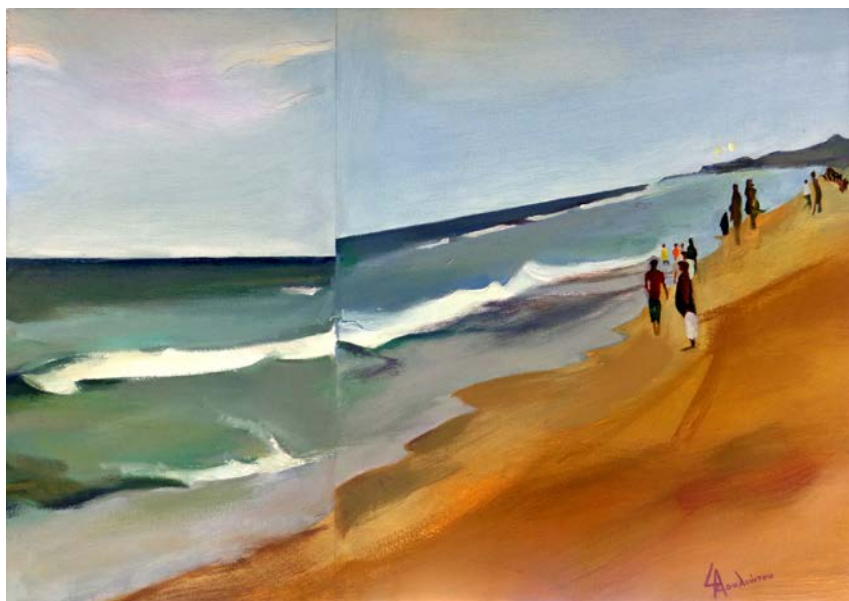
Σε επικλινή κύματα Ελαιογραφία σε καμβά, 70 X 100 εκ, 2018