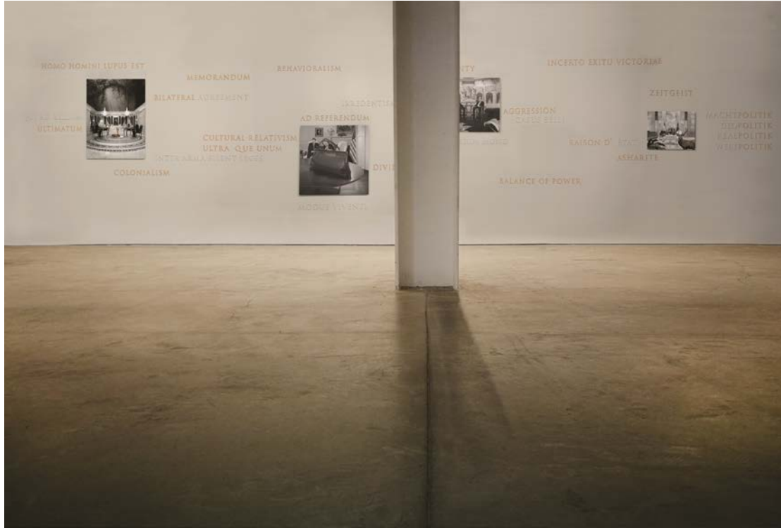
Installation view, Ileana Tounta Contemporary Art Center, 2019, Metal prints, dental clay