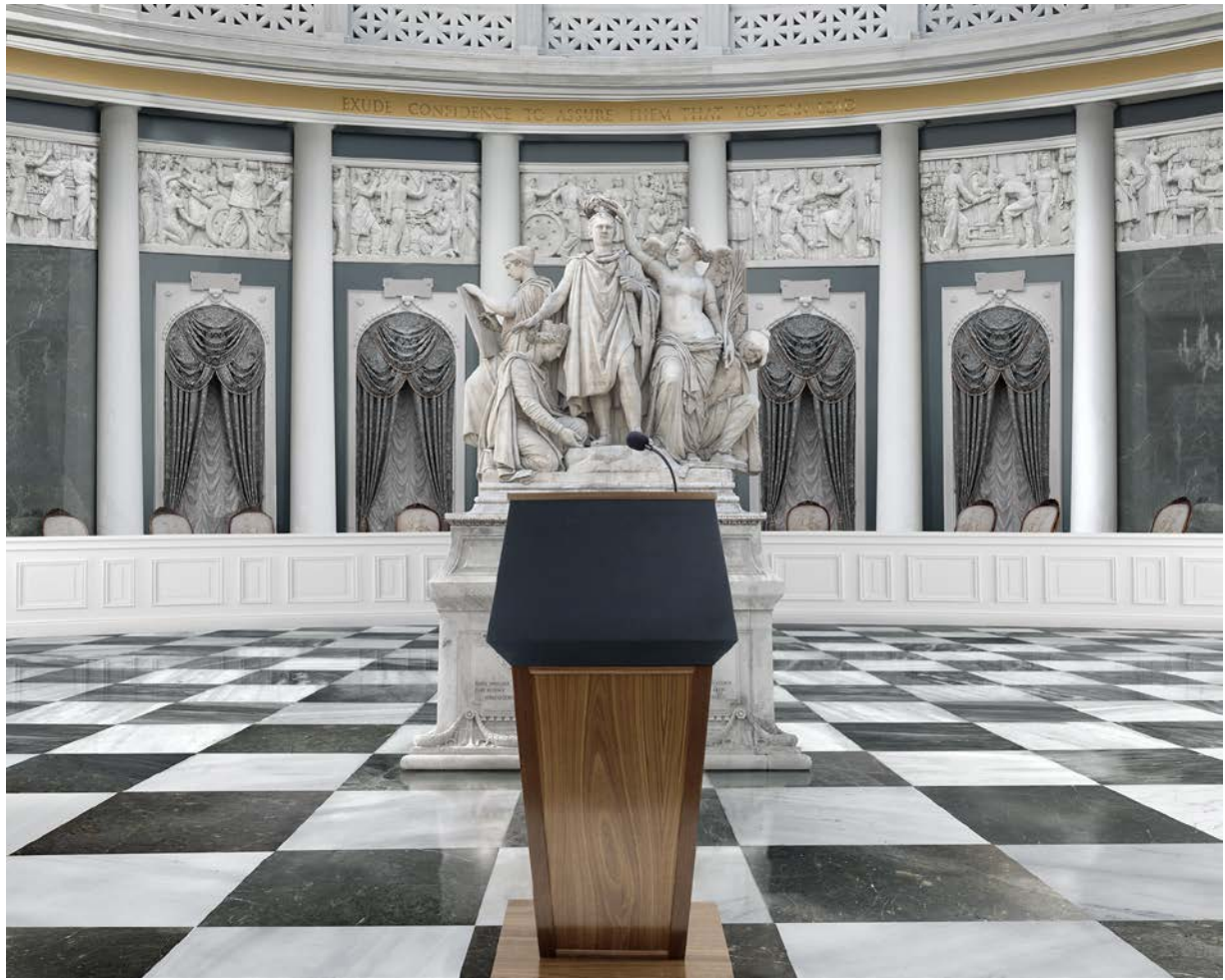
You Can Lead 2019 metal print