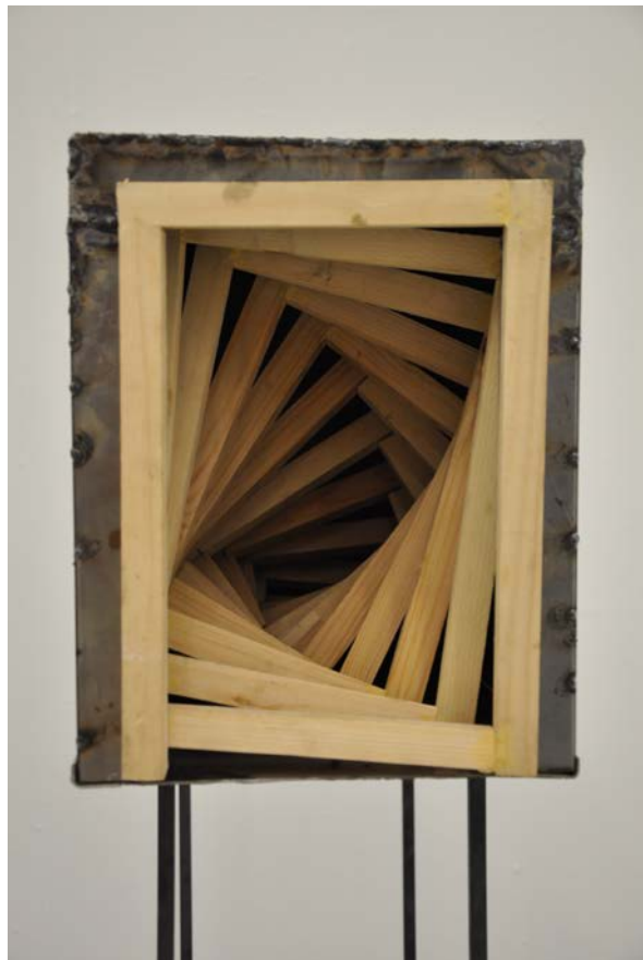
Το πέρασμα I και II