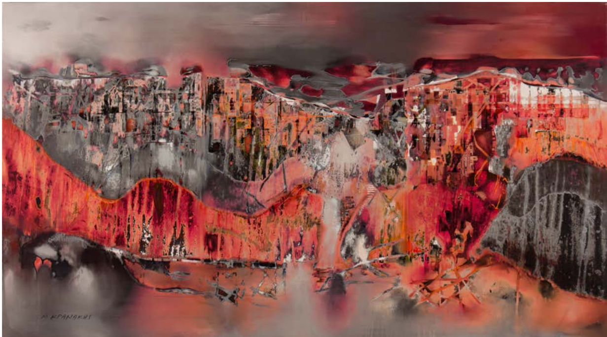
"Caldera" acrylic on canvas 100 x 180 cm 2015