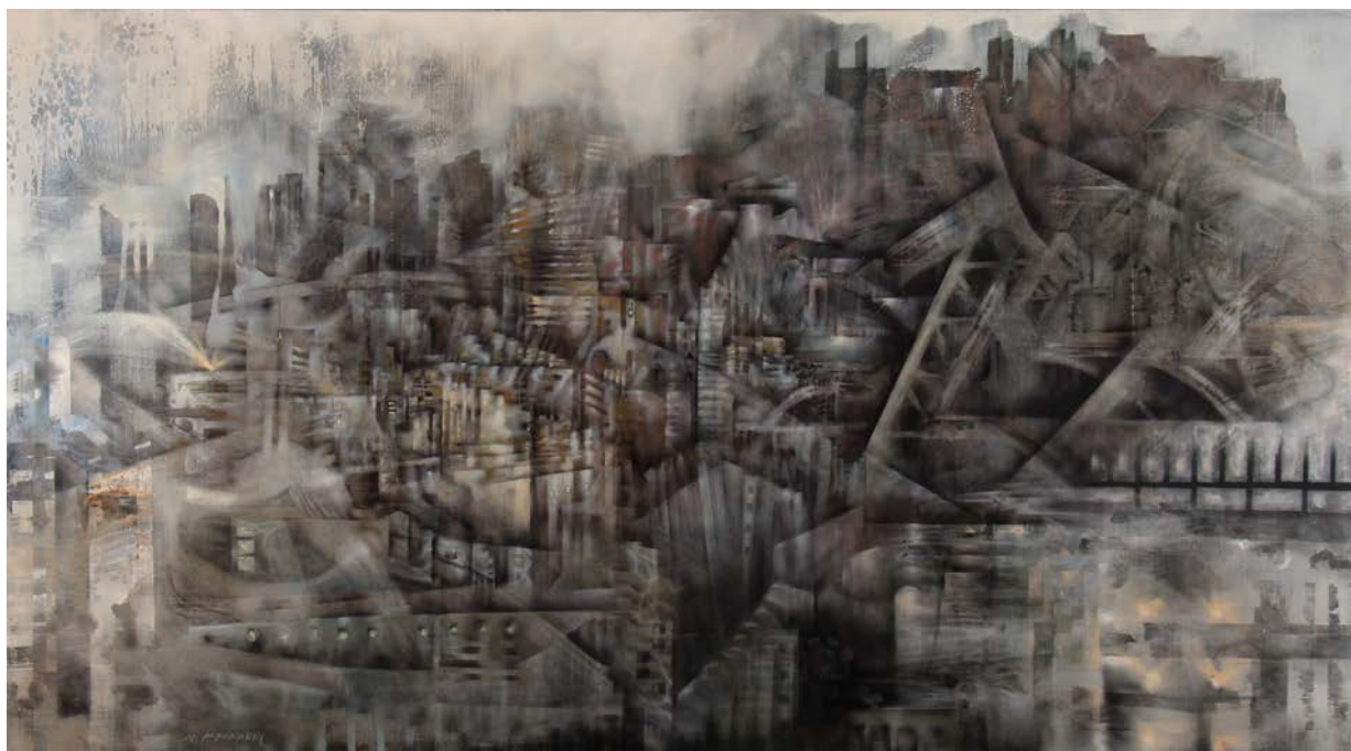
"Metropolis" acrylic on canvas 110 x 200 cm 2018